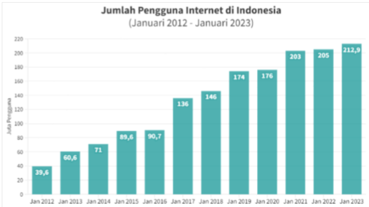
Gambar 1. Grafik Pengguna Internet di Indonesia

Pada era digital saat ini, Indonesia memiliki 212,9 juta pengguna internet pada awal tahun 2023. Jika dibandingkan dengan tahun lalu, jumlah tersebut mengalami peningkatan.