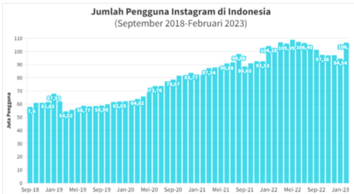
Gambar 3. Grafik pengguna Instagram di Indonesia

Pada era modern saat ini, sebagian besar individu tidak dapat berpaling dari penggunaan media sosial. Mereka sering menggunakannya sebagai bagian utama dari kehidupan sehari-hari mereka. Ini ditunjukkan pada Gambar 2 melalui Analisis situs web data We Are Social terhadap platform media sosial Instagram mengungkapkan bahwa platform tersebut menempati urutan ketiga di antara media sosial yang digunakan oleh masyarakat Indonesia.