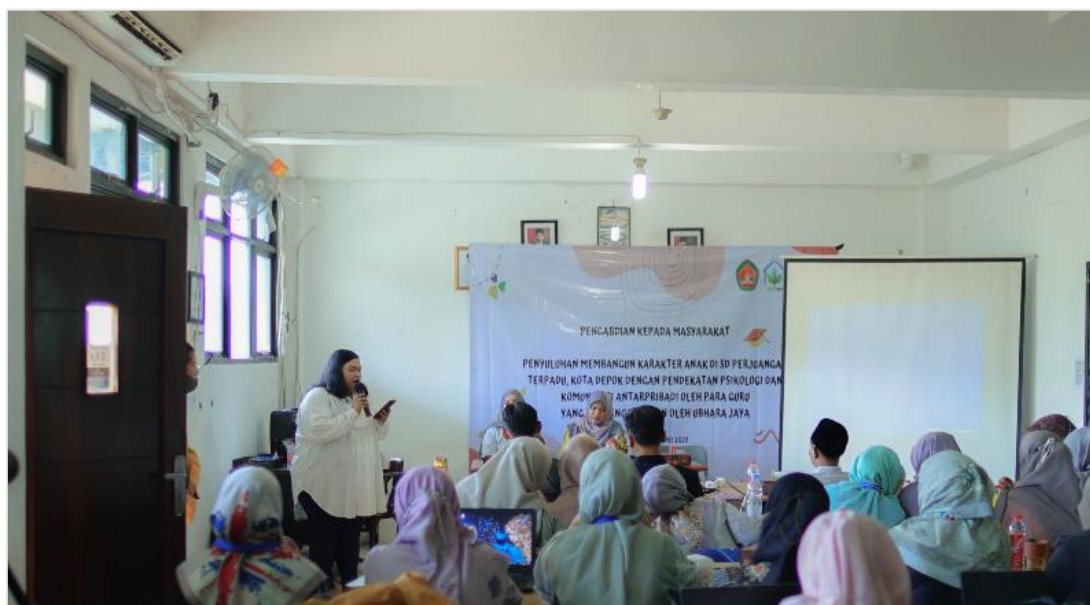
Gambar 2. Pemaparan Narasumber Mengenai Membentuk Karakter Siswa Melalui Komunikasi Antar Personal Guru dan Murid