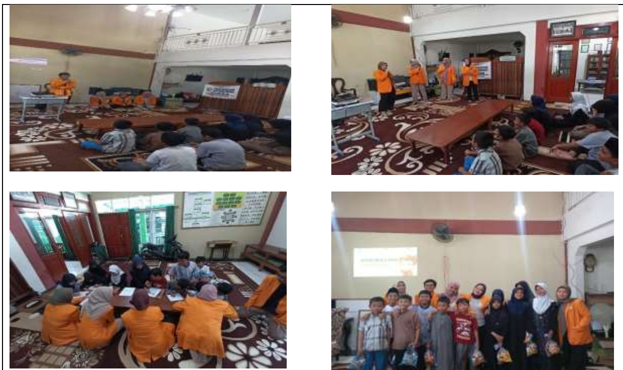
Gambar 2. Foto kegiatan pengabdian di panti asuhan Aisyiah.

Secara keseluruhan, kegiatan penyuluhan anti-bullying ini dinilai berjalan dengan baik dan mampu memberikan dampak positif terhadap peningkatan pemahaman serta sikap anak-anak dalam berinteraksi sosial. Adapun foto kegiatan pelaksanaan pengabdian ini adalah sebagai berikut: