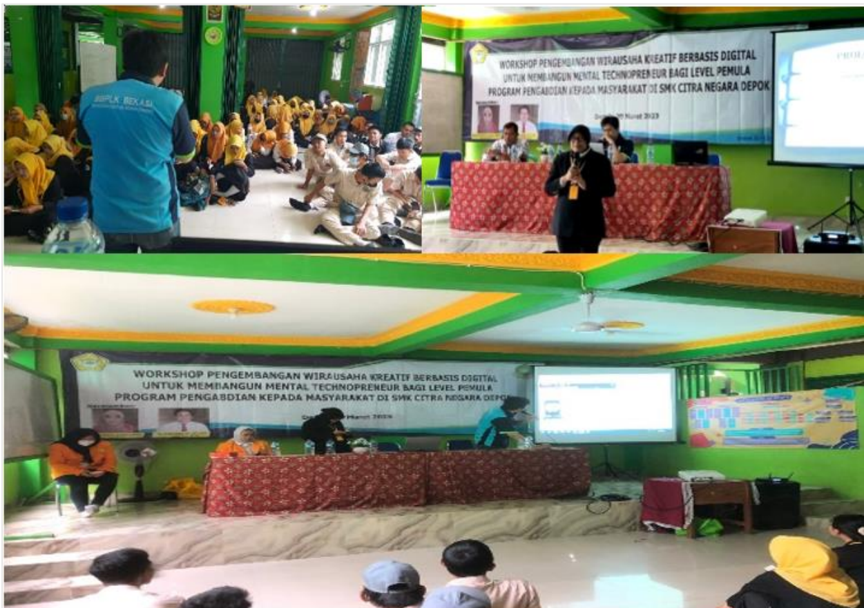
Gambar 3. Kegiatan Pengabdian Kepada Masyarakat Workshop Teknologi Digital bagi Wirausaha Pemula

Mengawali sesi tim narasumber memulainya dengan memberikan motivasi bisnis dan berbagi tentang wirausaha secara umum, setelah pemahaman tersebut dapat disampaikan dengan baik, maka materi diikuti dengan materi teknis teknologi dengan sedikit praktik mengenai dukungan teknologi sosial media dalam dunia bisnis. Para pemula bisnis dari SMK Citra Negara pun dapat menyimak dengan baik dan kondusif semua materi yang diberikan.